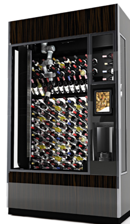
WINECAB WineWall winecab.com

Ngoài dấu ấn của siêu bò nước Ý, mẫu headphone gây ấn tượng với chất nhôm anod và da Alcantara cao cấp, sở hữu tính năng chống ồn chủ động, thời lượng sử dụng 24 giờ, cùng 3 tùy chọn màu sắc.