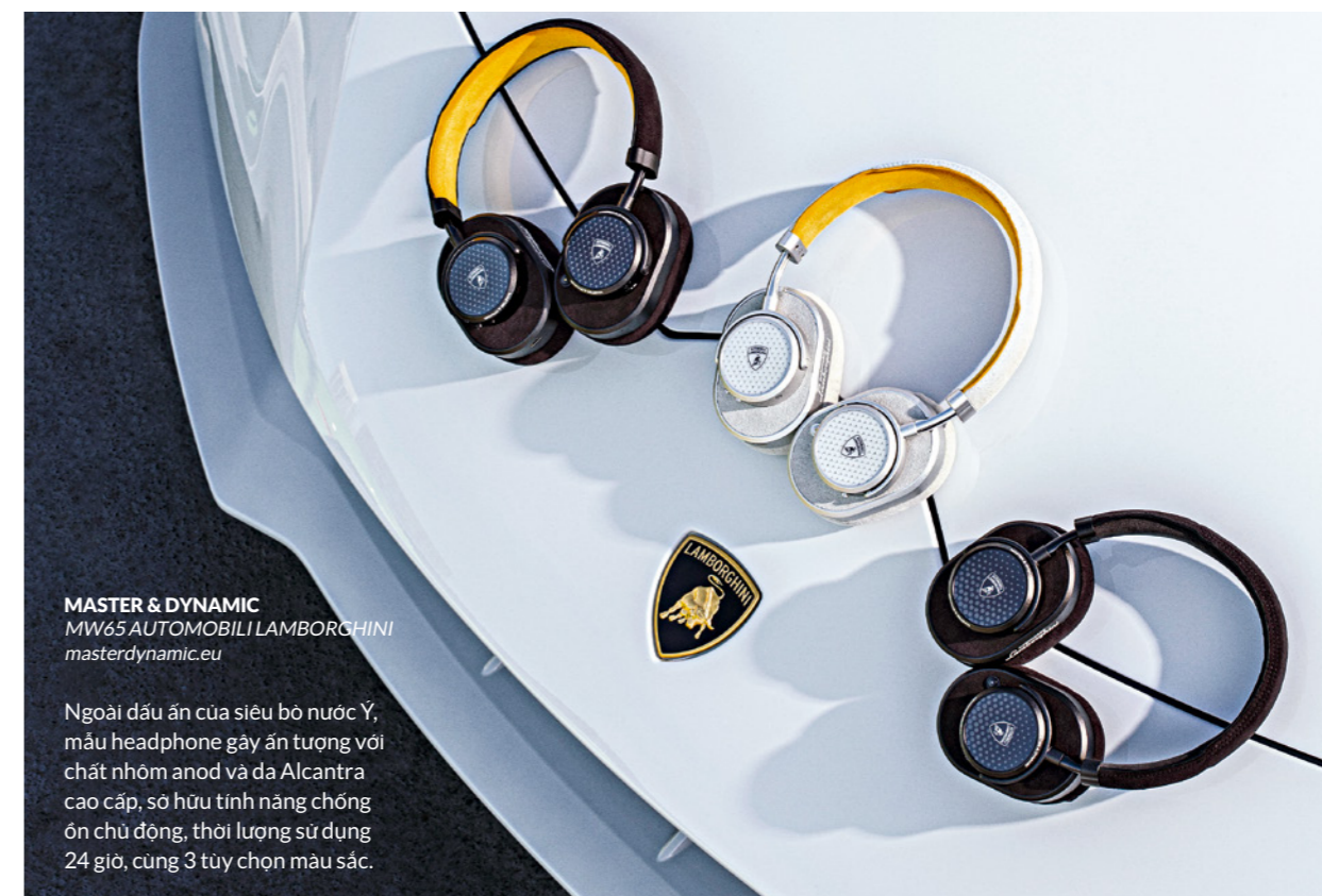
MASTER & DYNAMIC MW65 AUTOMOBILI LAMBORCHINI masterdynamic.eu

Ngoài dấu ấn của siêu bò nước Ý, mẫu headphone gây ấn tượng với chất nhôm anod và da Alcantara cao cấp, sở hữu tính năng chống ồn chủ động, thời lượng sử dụng 24 giờ, cùng 3 tùy chọn màu sắc.